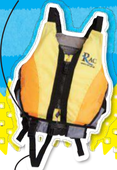
股下ベルトがある(子ども用)